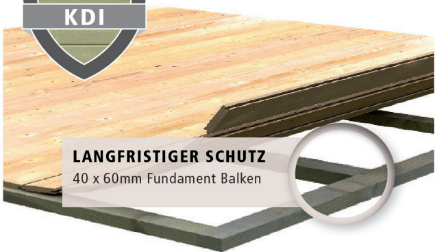
LANGFRISTIGER SCHUTZ 40 x 60mm Fundament Balken